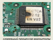
сгоревший процессор магнитолы

Внимание: провод «TV-CONT» выходящий из головного устройства может быть подключен только к проводу «TV-CONT» ТВ-тюнера.